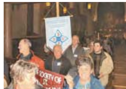
Charity & Justice: Walking the Social Mission