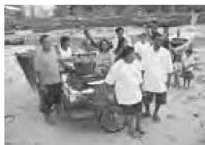
Une famille de pêcheurs et son nouveau bateau

23.210 euros ont également été dépensés en bateaux et filets de pêche, permettant aux familles de pêcheurs affectées de retourner à une vie "normale" dans les meilleurs délais.