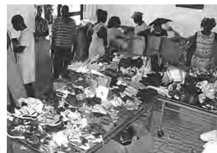
Le magasin de fortune