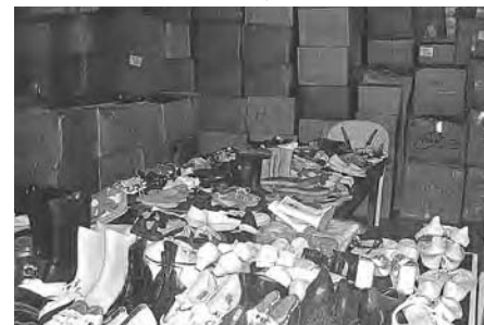
Plus de 300 boîtes ont été expédiées