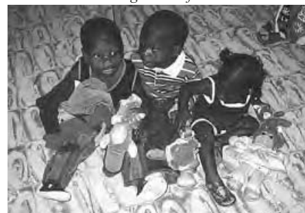
Des enfants contents de leurs nouveaux vêtements et jouets