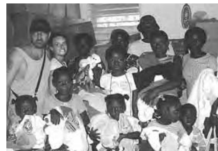
2 représentants avec des haïtiens heureux