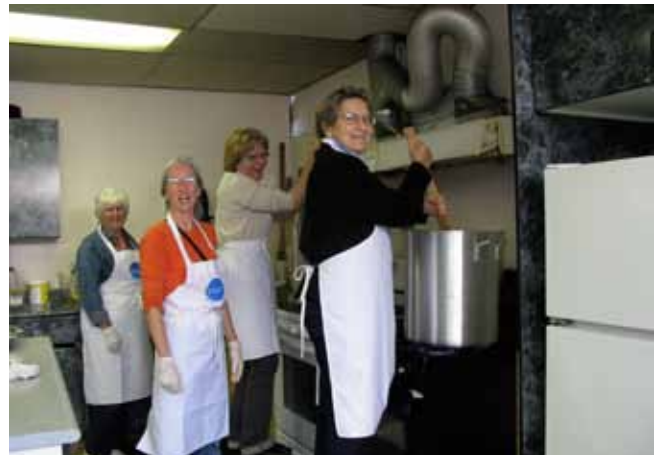
Nos Vincentiens préparent une excellente recette de chili.

Nous invitons les paroissiens à se joindre à nous lors de ces samedis. Il s'agit de préparer le chili le vendredi soir, puis de le terminer au centre le samedi.