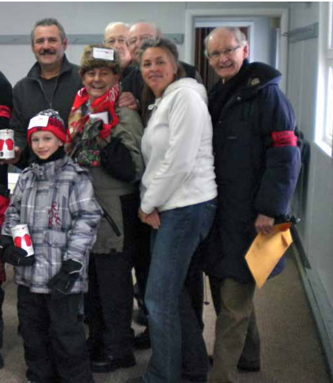
Membres de la conférence Saint-Denys-du-Plateau, Sainte-Foy QC