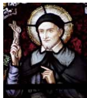
Photo du vitrail de saint Vincent de Paul à la Cathédrale Saint Joseph, Macon, Georgia, USA