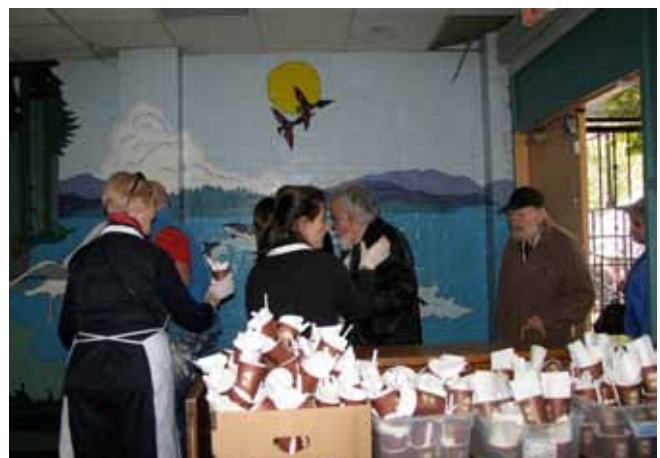
Nos Vincentiens aident à la distribution de repas chauds au centre d'accueil «The Door is Open».