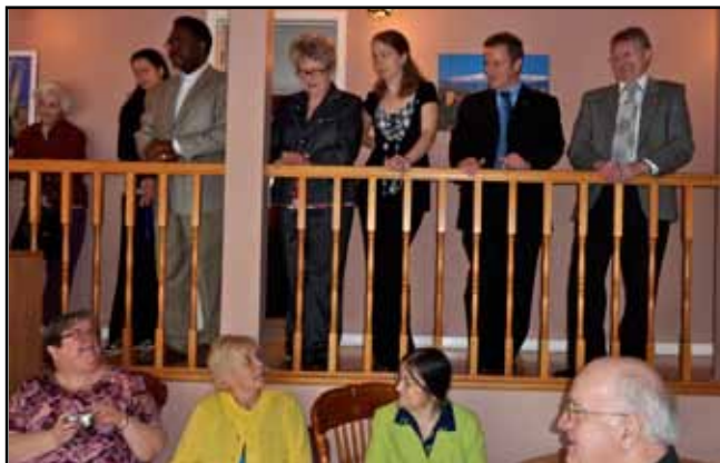
Vincentiens et membres du conseil d'administration