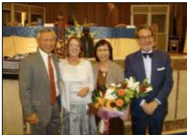
Les présidents et leurs épouses.