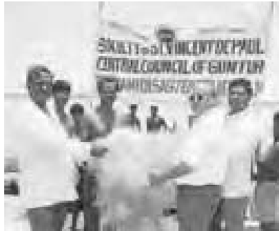
Des Vincentiens de Guntur remettent des filets de Pêche à des victimes

personnes âgées, petit projet de mariage) dans les zones les plus touchées pour un total de 13 600 000 Rs (250 000 euros)