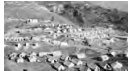
Un camp de victimes sur le chemin

d'en descendre par peur que leurs terres soient perdues ou confisquées. Ils avaient tendu des tentes sur de petits plateaux près des restes de leurs demeures, afin de pouvoir garder un oeil sur leur propriété » rapporte Valentine Gonsalves, Président national.