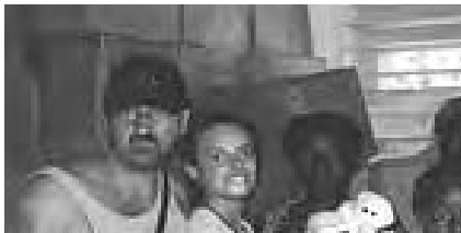
Le convoi d'aide de la SSVV

Le 7 décembre 2005, 7 camions chargés de couvertures quittèrent Rawalpindi sous escorte de l'Armée, le convoi ayant à traverser des zones dangereuses pour atteindre les endroits où les Vincentiens avaient décidé d'apporter leur aide: Muzaffarabad, dans l'Azad Kashmir. Un groupe de Vincentiens, dont le Président et le Vice-Président nationaux partit le lendemain.