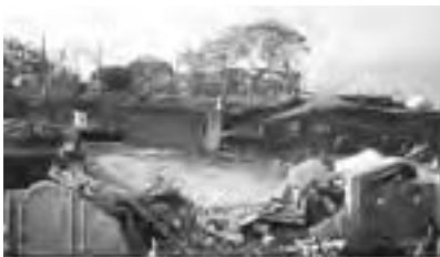
Dégâts aux habitations

Le Bureau du Conseil national de la Société au Pakistan s'est immédiatement réuni, à l'instar de l'ensemble du pays, pour lever des fonds et organiser l'aide. Il y avait des besoins en nourriture, en vêtements, médicaments, logement, etc. mais le besoin principal d'urgence était l'équipement et la machinerie destinés à sauver les vies de personnes prisonnières des décombres de leurs maisons, enterrées sous les énormes coulées de boue et glissements de terrain.