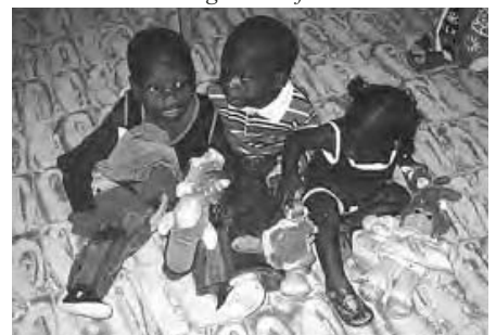
Des enfants contents de leurs nouveaux vêtements et jouets