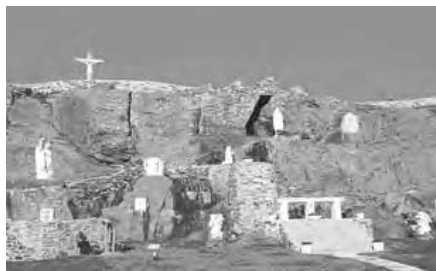
Grotte de Notre-Dame de Lourdes, Flatrock, T.-N.-L.

Venez profiter de la vie sur « notre Pierre ».