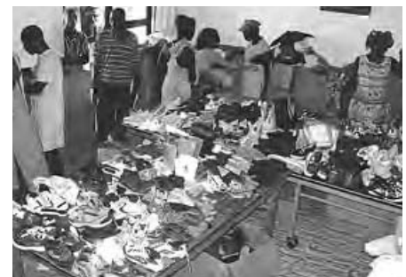
Le magasin de fortune