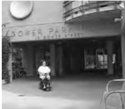
Une résidente de Gower Park accueillant les visiteurs à l'entrée du complexe de 164 logements à prix modique de la SSVP