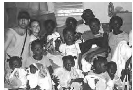
2 représentants avec des haïtiens heureux