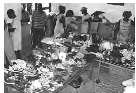
Le magasin de fortune