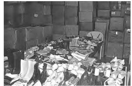
Plus de 300 boîtes ont été expédiées