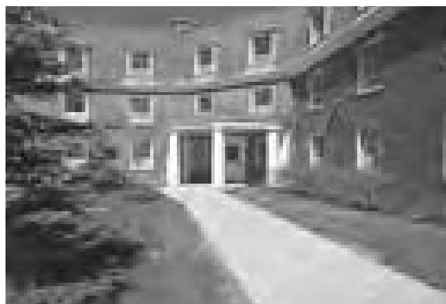
Campus de L'Université Memorial