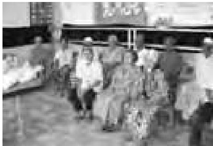
Un groupe de Musulmans aidés par la SSVP

bateaux et des outils aux pêcheurs et aux travailleurs et à aider des enfants dans le domaine de l'éducation.