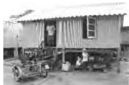
Une nouvelle maison pour une famille Thaïe