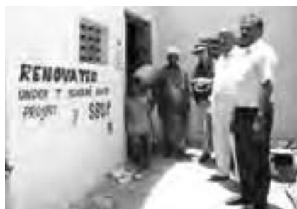
Maison rénovée en Inde

Ce projet a de très bon résultats, et le Conseil International en reçoit une comptabilité précise de la part du Conseil National de l'Inde.