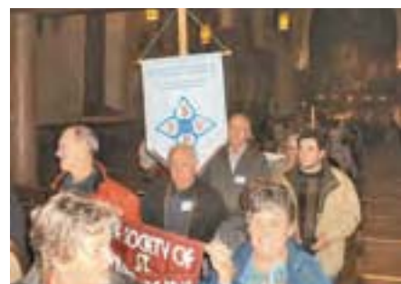
Charity & Justice: Walking the Social Mission