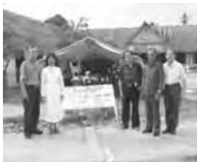
Le Président national et la Structure Internationale visitant une école temporaire

La partie médicale du projet consiste en des soins médicaux pour 20 personnes sur une période de 6 mois, pour un coût total de 15.550 euros.