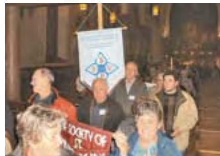
Charity & Justice: Walking the Social Mission