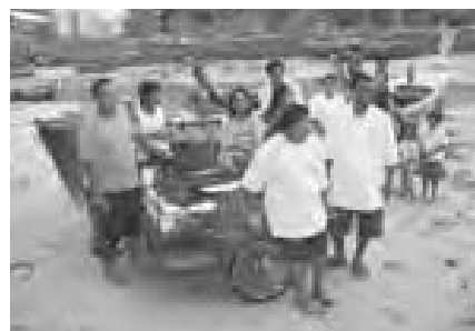
Une famille de pêcheurs et son nouveau bateau

23.210 euros ont également été dépensés en bateaux et filets de pêche, permettant aux familles de pêcheurs affectées de retourner à une vie "normale" dans les meilleurs délais.