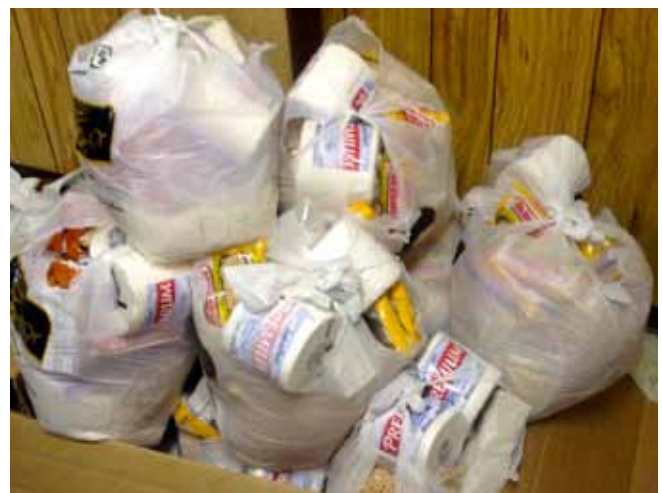
Paquets contenant une subsistance de deux semaines, préparés et prêts pour livrer aux démunis