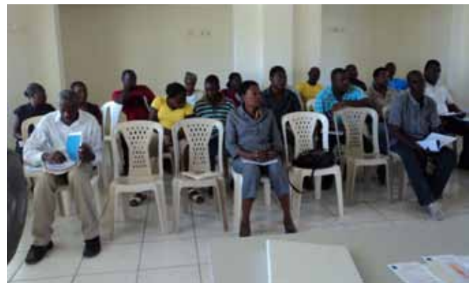
Formation des formateurs (première semaine)

Jean-Noël Cormier, président Conseil national du Canada