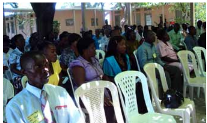
170 participants à la messe du deuxième dimanche