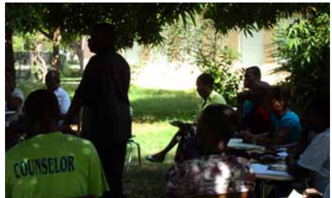
Classe extérieure (deuxième semaine)