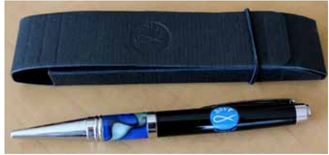
Stylo avec boîte cadeau en carton - 17,50$

Ton Bois Décor ; hauteur environ 20 cm. Ces statues sont réalisées en HYDRACAL résine acrylique. Ce matériau est d'aspect proche du plâtre, mais beaucoup plus solide, comme une résine.