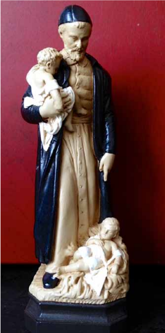
Statue de saint Vincent de Paul de BACCI SARL (France) - 55$

Ton Bois Décor ; hauteur environ 20 cm. Ces statues sont réalisées en HYDRACAL résine acrylique. Ce matériau est d'aspect proche du plâtre, mais beaucoup plus solide, comme une résine.