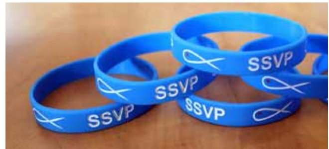
Bracelets SSVP - 1,00$

Consultez notre catalogue en ligne pour plus d'informations :