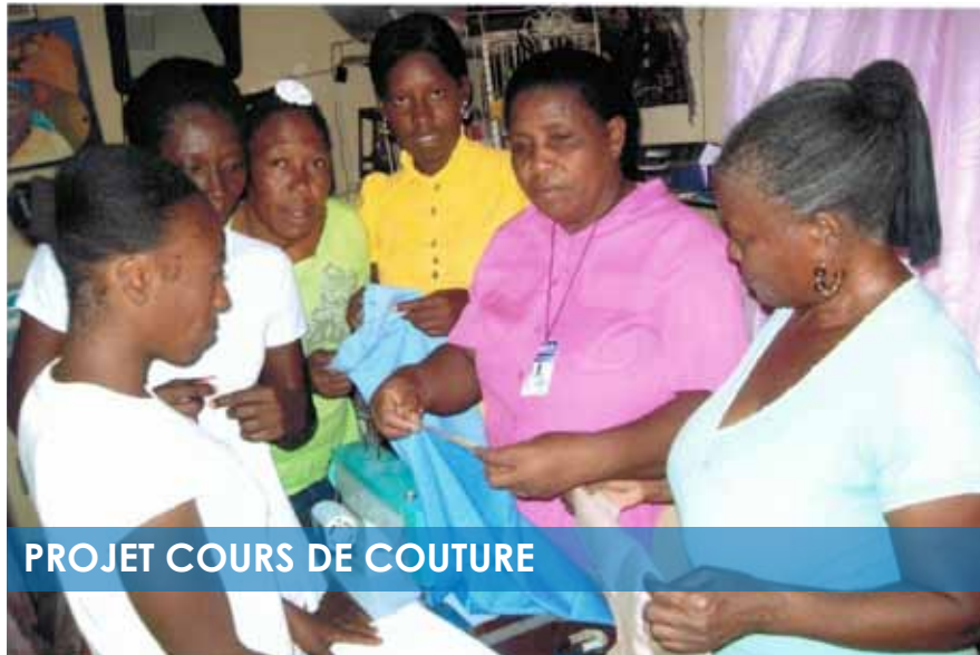
PROJET COURS DE COUTURE