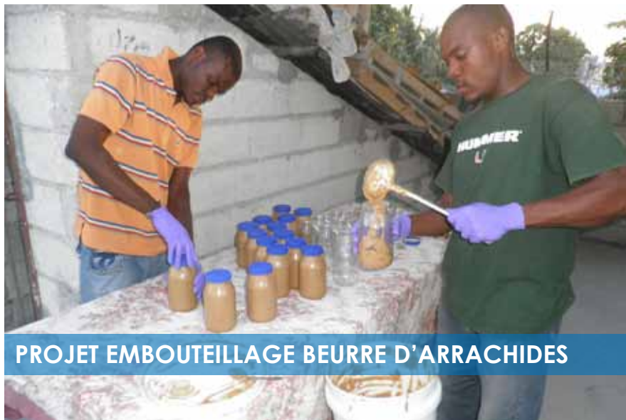
PROJET EMBOUTEILLAGE BEURRE D'ARRACHIDES