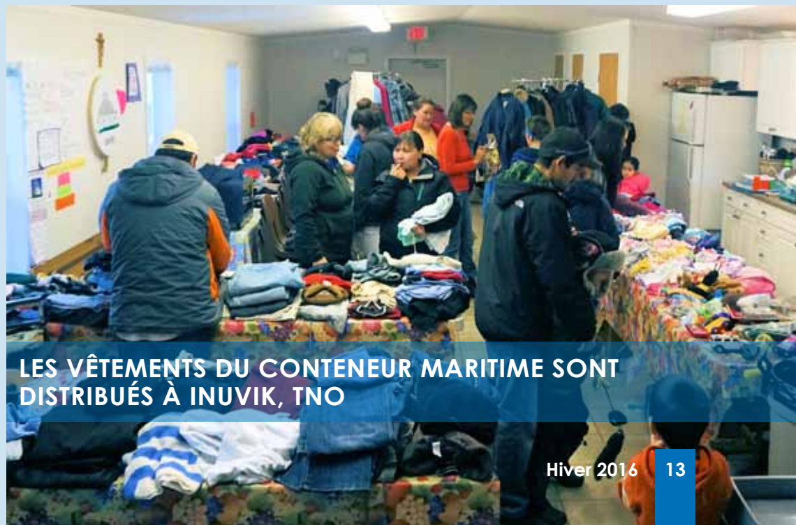
LES VÊTEMENTS DU CONTENEUR MARITIME SONT DISTRIBUÉS À INUVIK, TNO

catholique romaine Our Lady of Victory, qu'on appelle aussi l'église igloo d'Inuvik, mais ses responsabilités pastorales s'étendent partout en Arctique occidentale.