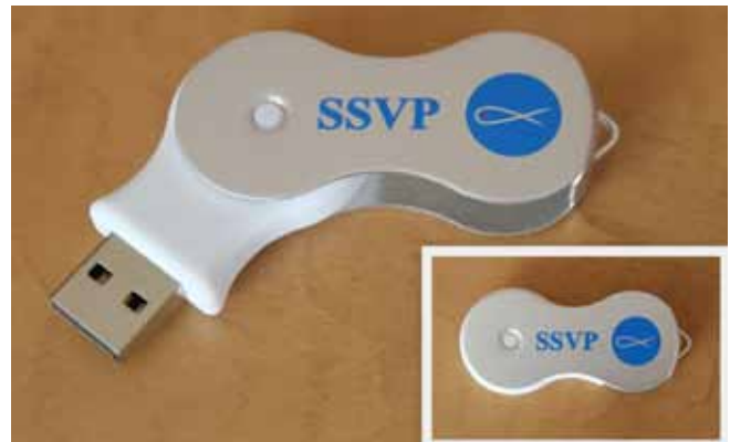
Clé USB 2.0 SSVP 8GB - 10,00$