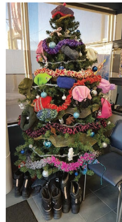
Arbres de chaleur SSVP - Prince George, C.-B. Collecte de gants d'hiver neufs ou légèrement usés et bottes d'hiver.