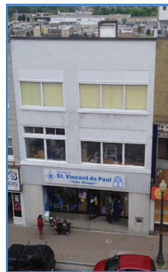
Magasin SSVP de Brant, au 143, Wellington

du projet seront vraisemblablement exempts de dette à la fin de la période sans intérêts.